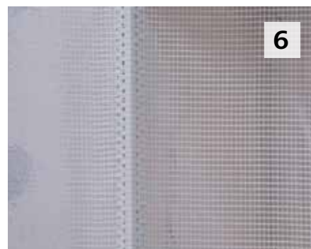
6 Je positionne les baguettes d'angle