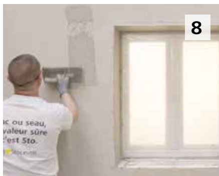
8 Je termine le sous-enduit en partie courante, puis l'enduit de finition. Avec des arêtes parfaites !