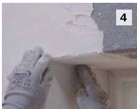
4 Je positionne les mouchoirs d'angle Sto-Mouchoir-Prédécoupé