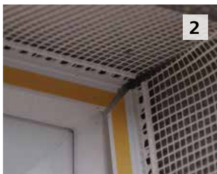
2 Je positionne les Sto-Profil Pro aux jonctions de menuiserie