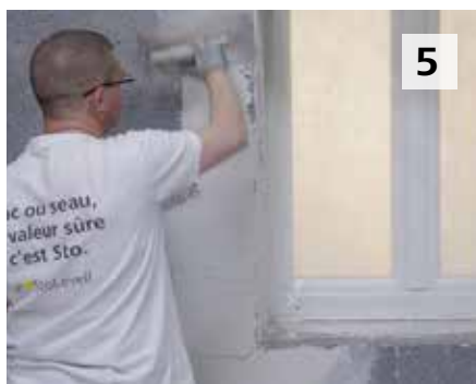
5 Appliquer du sous-enduit en façade également