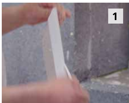
1 J'enlève la languette collante du Sto-Profil Pro