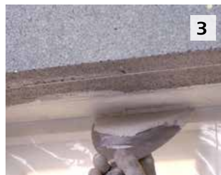
3 Maroufler le treillis du Sto-Profil Pro