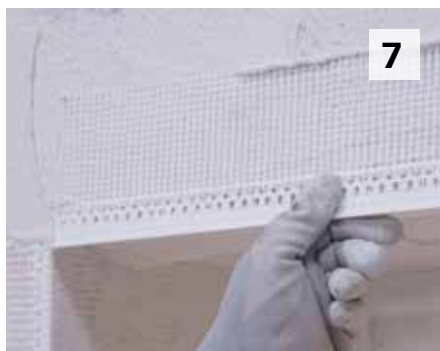
7 Je positionne la Sto-Armature Goutte d'Eau en linteau